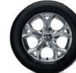
17"-os Könnyűfém keréktárcsa