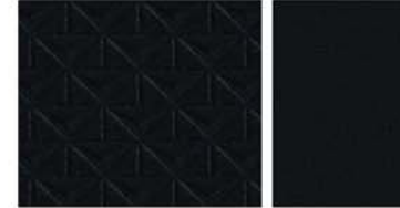
ACENTA & VISIA ALAPFELSZERELTSÉG Fekete dombornyomott / Fekete kárpit