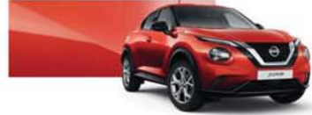
Napnyugta vörös (M) - NBV