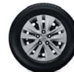
16"-os dísz tárcsa