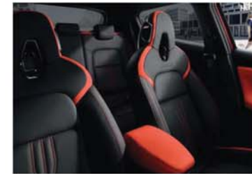
N-DESIGN NARANCS CSOMAG Fekete, részben bőr, narancsszín betétekkel