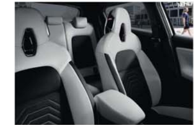
N-DESIGN FEHÉR CSOMAG Fekete, szintetikus bőr, fehér betétekkel