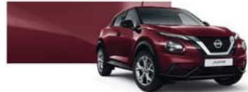
Burgundi (M) - NBQ