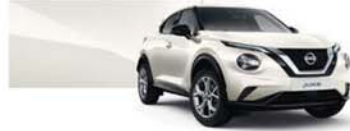
Gyöngyház fehér (P) - QAB