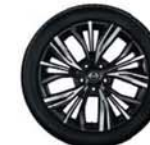
19"-os könnyűfém keréktárcsa