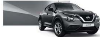
Fegyverszürke (M) - KAD