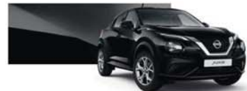
Metál Fekete (M) - Z11