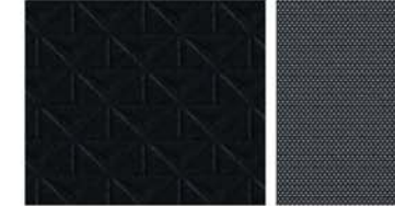
N-CONNECTA ALAPFELSZERELTSÉG Fekete dombornyomott kárpit / Fekete kárpit