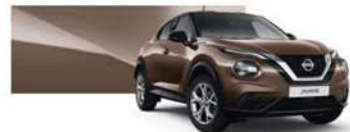
Gesztenyebarna (M) - CAN