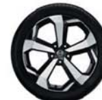
19"-os Akari könnyűfém keréktárcsa