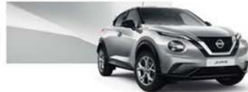
Ezüst (M) - KYO