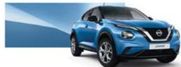
Élénk kék (M) - RCA