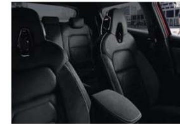
N-DESIGN FEKETE CSOMAG Fekete Alcantara®, részben bőr, fekete betétekkel