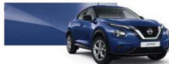
Indigó kék (M) - RBN