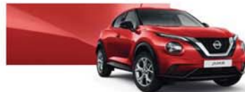
Piros (S) - Z10