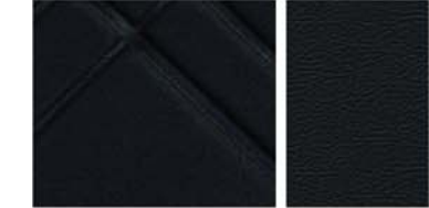
TEKNA ALAPFELSZERELTSÉG Részben fekete szintetikus bőr és szövet