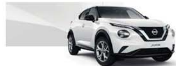
Fehér (S) - 326